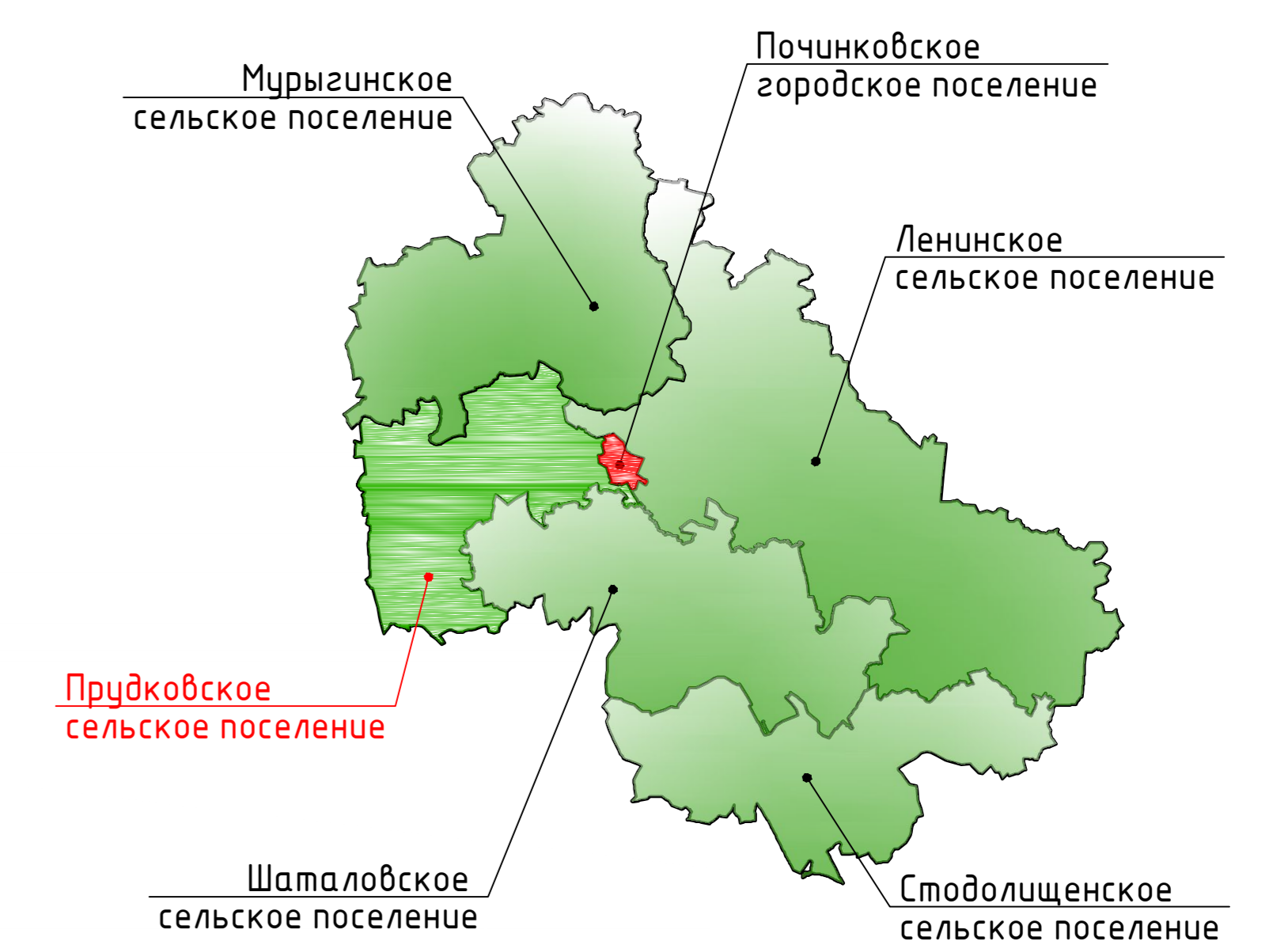
Схема расположения Прудковского сельского поселения Починковского района Смоленской области

Карта градостроительного зонирования поселения. М 1:25000.