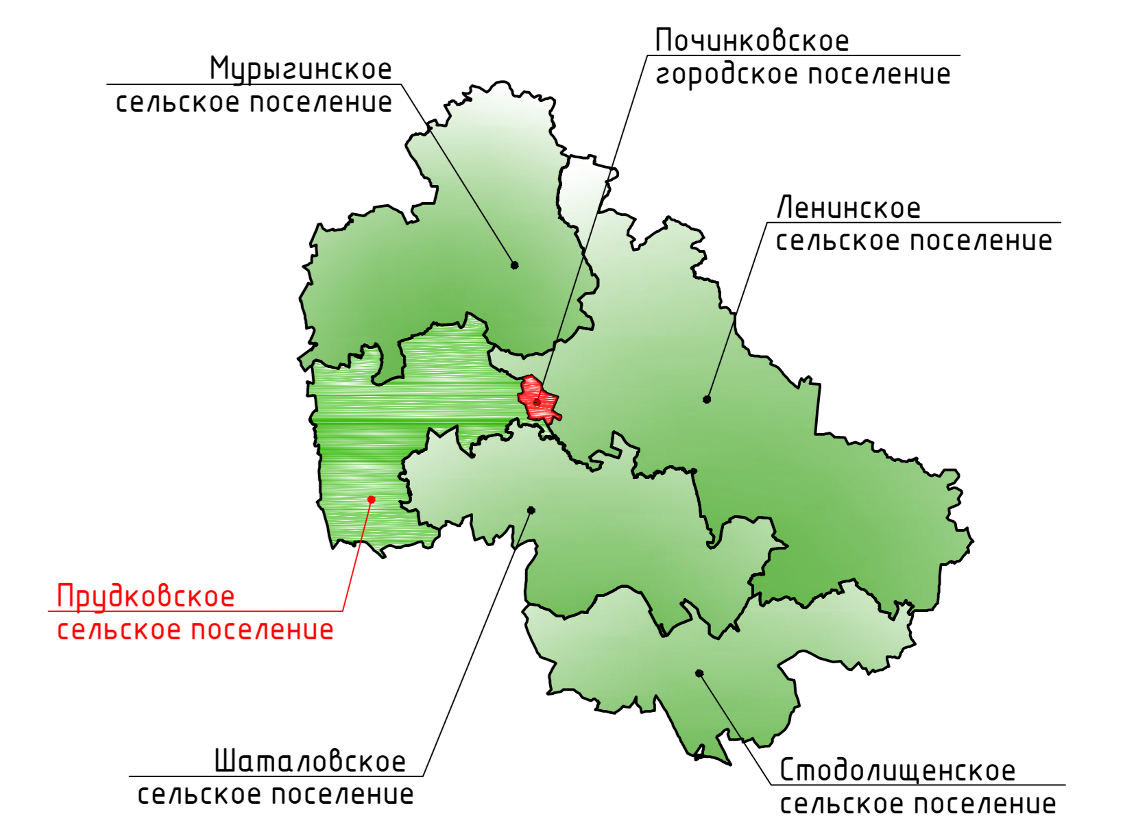
Схема расположения Прудковского сельского поселения Починковского района Смоленской области

Карта функциональных зон поселения. М 1:25000.