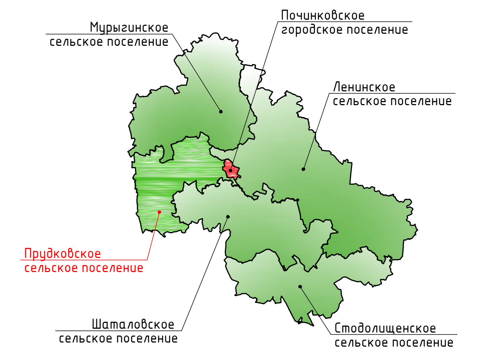
Схема расположения Прудковского сельского поселения Починковского района Смоленской области

Карта границ населенных пунктов (в том числе границ образуемых населенных пунктов), входящих в состав поселения. М 1:25000.