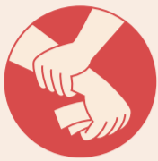
Схема предназначена только для обогащения своих создателей